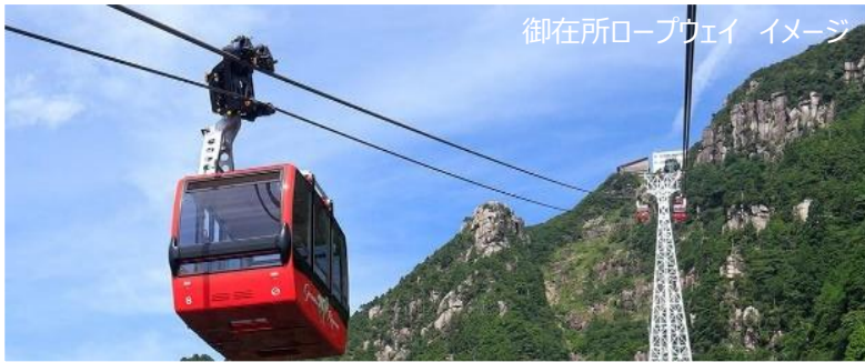
御在所ロープウェイ イメージ

アクアイグニスでのランチと片岡温泉入浴と御在所ロープウェイの往復乗車券・伊勢海老パイのお土産のセットプランです。