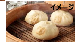
イメージ C.豚まん・あんまん