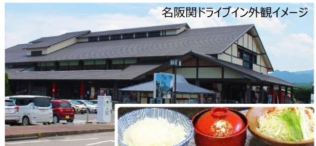
名阪関ドライブイン外観イメージ