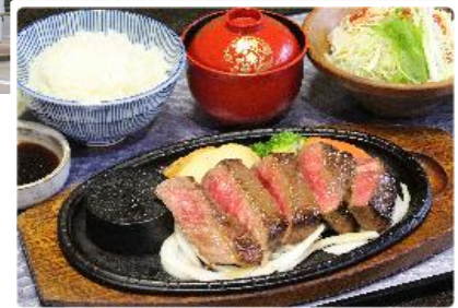
松阪牛ステーキ膳 イメージ

■旅行代金（※こども：4歳以上小学生以下） 大人 6,000円 さらにみえ旅キャンペーン適用で⇒ 3,500円 こども 5,000円 さらにみえ旅キャンペーン適用で⇒ 2,500円 + 地域応援クーポンおひとり様 2,000円 分付き！