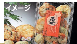
イメージ A.磯揚げ天ぷらセット