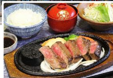
松阪牛ステーキ膳 イメージ