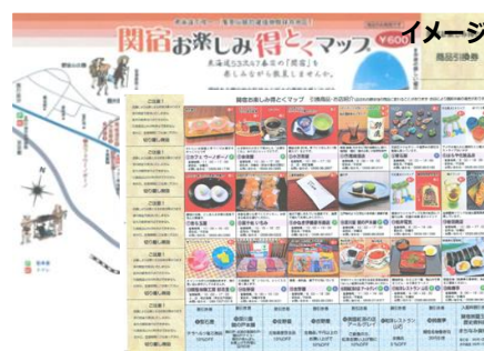
関宿お楽しみ得とくマップ