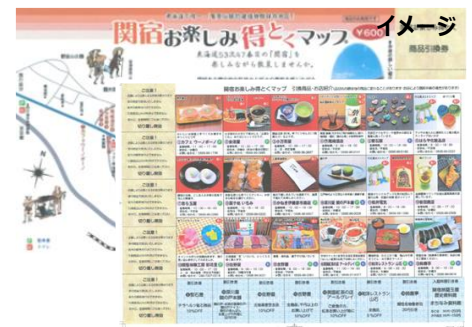
関宿お楽しみ得とくマップ