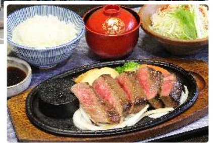
松阪牛ステーキ膳 イメージ

各地—★名阪関ドライブイン着 インフォメーションにて受付【昼食と関宿お楽しみ得とくマップをゲット】— —<東名阪自動車道・新名神高速道路>—菰野インター —★御在所ロープウェイ（ロープウェイ乗り場山麓駅窓口でチケットと交換）—各地