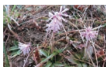
ショウジョウバカマ 4月～5月