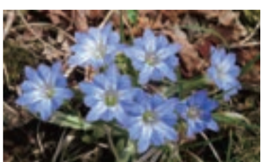
タテヤマリンドウ 4月～5月