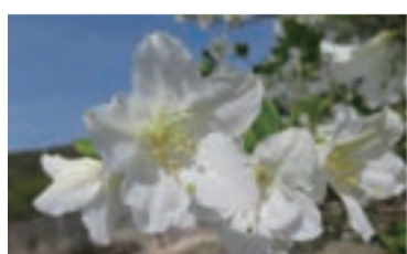
シロヤシオ 5月下旬～6月上旬